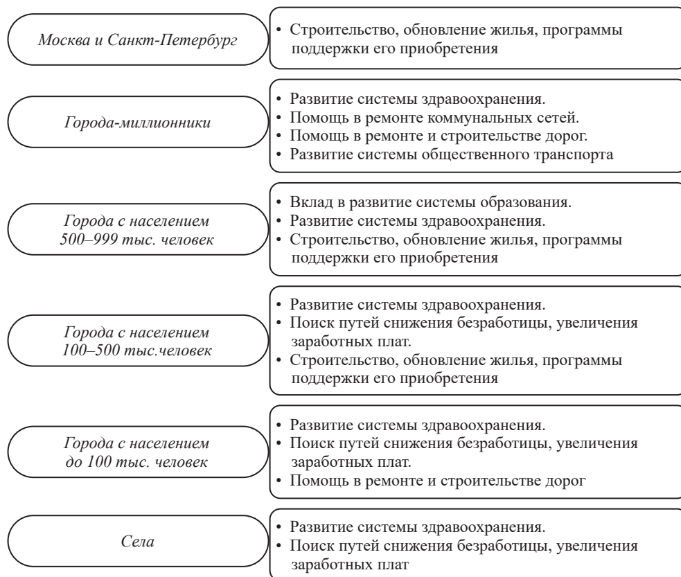
Рис. 3. Приоритеты предприятий в развитии городов присутствия (и сел), в зависимости от численности населения в них