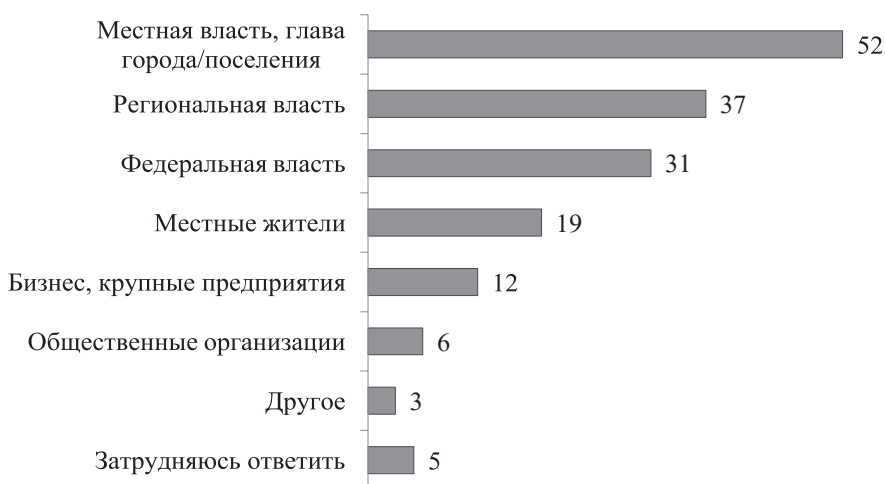
Рис. 1. Распределение ответов на вопрос: «На Ваш взгляд, от чьих действий в первую очередь зависит комфортность Вашего населенного пункта?» (опрос ВЦИОМ, март 2025 г., закрытый вопрос, до 2 ответов, % всех опрошенных)

Такая низкая оценка, как отмечают эксперты ВЦИОМ, имеет место вопреки значительным налоговым выплатам и реализации программ социальной ответственности компаниями. Кроме того, отмечается, что даже среди жителей населенных пунктов до 100 и от 100 до 500 тыс. человек значение этим усилиям придается недостаточное (12–15%), несмотря на их градообразующую функцию, что проиллюстрировано на рис. 2.